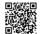
金春円満井会ホームページ

申込開始日：四月二十一日(火) 正午(十二時)、先着順 金春円満井会ホームページに掲載の申込みフォームからお申込みください。 事前にお申し込みの無い方はご入場いただけません。