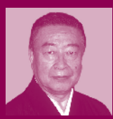
中村 裕 (なかむらゆう)

作家。1959年、新潟市内野町生。1993年「ゾーンを左に曲がれ」で作家デビュー。1998年「ブエノスアイレス午前零時」で第119回芥川賞受賞。『サイゴン・ピクアップ』『武曲』など著書多数。2021年に佐渡での最晩年の世阿弥を描いた『世阿弥最後の花』を発表。法政大学名誉教授。