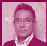
藤沢 周 (ふじさわしゅう)

作家。1959年、新潟市内野町生。1993年「ゾーンを左に曲がれ」で作家デビュー。1998年「ブエノスアイレス午前零時」で第119回芥川賞受賞。『サイゴン・ピクアップ』『武曲』など著書多数。2021年に佐渡での最晩年の世阿弥を描いた『世阿弥最後の花』を発表。法政大学名誉教授。